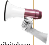
Kuva 1. Soteuttamon esimerkkiohjelma