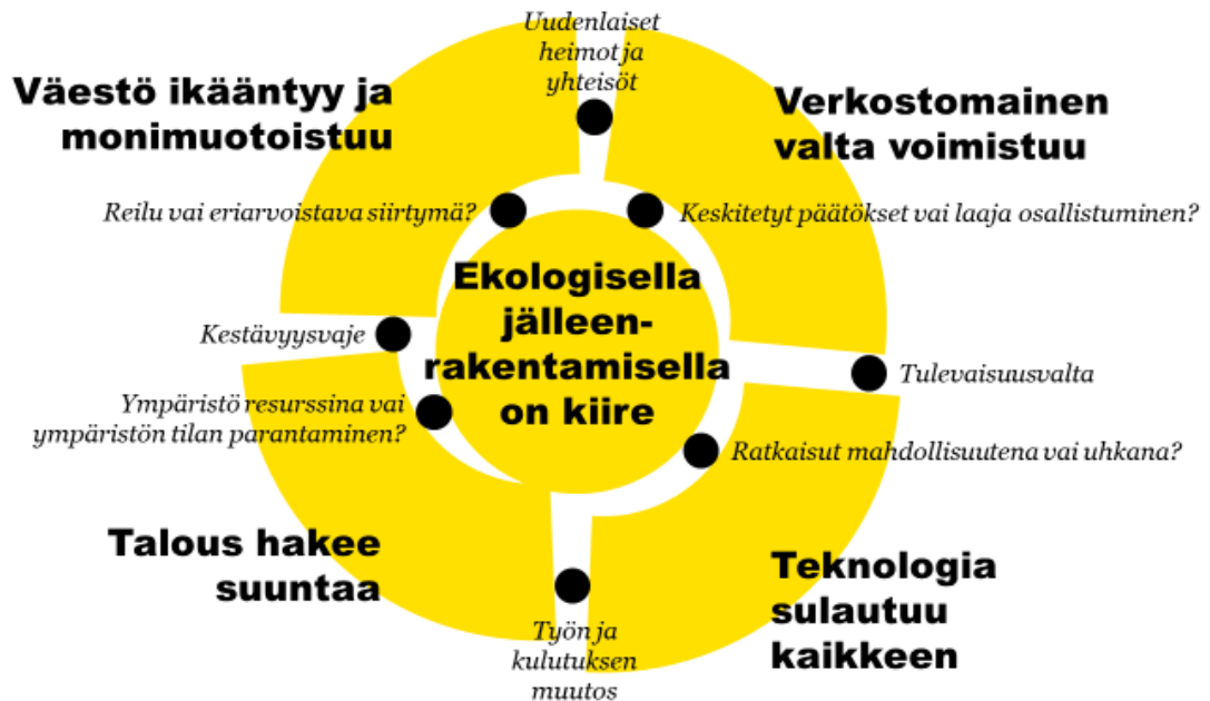
Kuva 1. Megatrendien kokonaiskuva

Ekologisen kestävyyskriisin tarkasteleminen suhteessa muihin tulevaisuuden kehityssuuntiin avaa hyvin megatrendien keskinäisiä jännitteitä. Ensimmäinen jännite liittyy tasapainoiluun nopeiden päätösten ja osallisuuden ja demokratian vahvistamisen välillä. Tilanteen tekee haastavaksi valtasuhteiden monisolmuistuminen, eli vallan määrittäminen verkostoissa, muun muassa taloudellisen, teknologisen ja kulttuurisen vuorovaikutuksen määrän suhteen. Yhteiskuntajärjestelmät ovat koetuksella sen suhteen, mikä niistä tarjoaa parhaimman tavan vastata ekologiseen kestävyyskriisiin ja monimutkaisen maailman haasteisiin. Osa kokee demokratian liian hitaaksi ja etäiseksi tavaksi päättää asioista tilanteessa, jossa aika loppuu kesken. Globaalilla tasolla vahvojen johtajien toivotaan tuovan yksinkertaisuutta hämmäntävään tilanteeseen, mutta toisaalta myös ruohonjuuritason vaikuttaminen on nousussa.