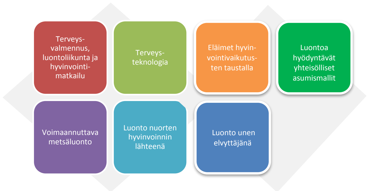
Kuva 4. Esimerkkejä liiketoimintamahdollisuuksien osa-alueista.

Luonto hoivaa ja edistää terveyttä. Puistoissa, parvekkeilla, kaupunkiviljelmillä ja sosiaalisilla maatiloilla Green care -toiminnan ajatukset yhdistyvät hyvinvointia lisäävään käsillä tekemiseen ja yhdessä tekemiseen. Lemmikkieläinten suosio puolestaan kertoo ihmisten eläinten kanssa tapahtuvan vuorovaikutuksen arvostamisesta. Näillä toiminnoilla on merkitystä paitsi ihmisten liikuttajina, myös mielenterveyden edistäjinä ja tämä näkökulma on yhä yleisemmin tunnustettu erilaisissa hoivakodeissa ja sairaaloissa.