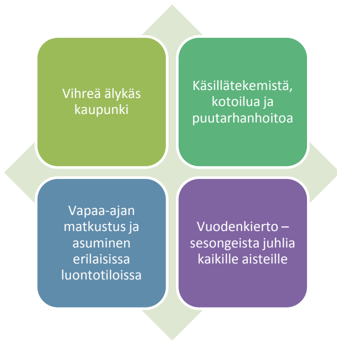
Kuva 2. Esimerkkejä liiketoimintamahdollisuuksien osa-alueista.

Luonto ja uusimmat teknologiset sovellukset muodostavat yhdessä kestävän ja viihtyisän asuinympäristön onnistuneet rakennustekijät. Ihmisten arjen keskellä luonto tarjoaa lukuisia mahdollisuuksia ilmaista ja toteuttaa itseään ja oman elämäntavan mukaisia arvoja. Matkustaminen ja uusien elämysten kokeminen voi kaukokohteen ohella suuntautua yhtä hyvin opastetulle kierrokselle lähiluontoon. Luonnon elementeistä ammentavat juhlat tuottavat kevyen yhteisöllisyyden kokemuksia.