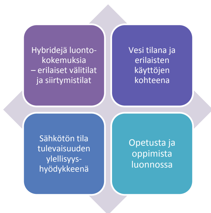
Kuva 3. Esimerkkejä liiketoimintamahdollisuuksien osa-alueista.

Teknologian avulla tuotetaan hybridejä luontokokemuksia ja muokataan erilaisiin siirtymä- ja välitiloihin luontoistettuja paikkoja. Suomalainen luonto tarjoaa mahdollisuuksia tuottaa uusille käyttäjäryhmille, kuten sähkömagneettista säteilyä välttäville, uudentyyppisiä palveluja. Veden hyvinvointivaikutuksia hyödyntävien palvelujen kysyntä on kasvanut merkittävästi ja se tuo mukanaan myös turisteja. Luontoon liittyvä oppiminen kiinnostaa niin aikuisia kuin lapsia.